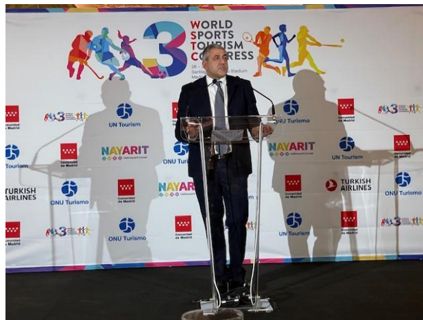
Monsieur Zurab Pololikashvili, Secrétaire général UN Tourisme souhaite la bienvenue aux invités