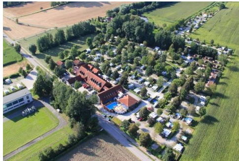
Un quartier de Bad Griesbach

Des collines douces, une vieille ville pittoresque et une vue panoramique jusqu'aux Alpes - c'est ainsi que se décrit la station thermale de Bad Griesbach im Rottal. (vallée de la Rot)