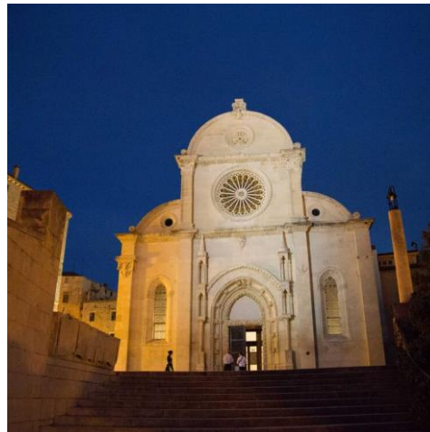
La cathédrale Saint-Jacques à Šibenik – patrimoine culturel mondial de l'UNESCO

Pour plus d'infos, écrivez à : ukh@camping-croatia.com