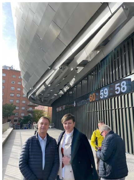
Frau Monika Udovicic Staats-Sekretärin Ministerium für Tourismus und Sport Kroatien