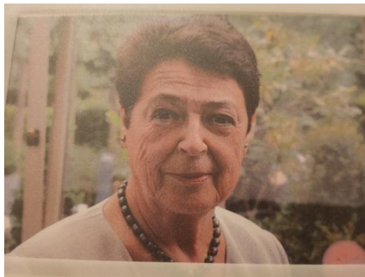
ihr 40jähriges F.I.C.C. Dienstjubiläum.