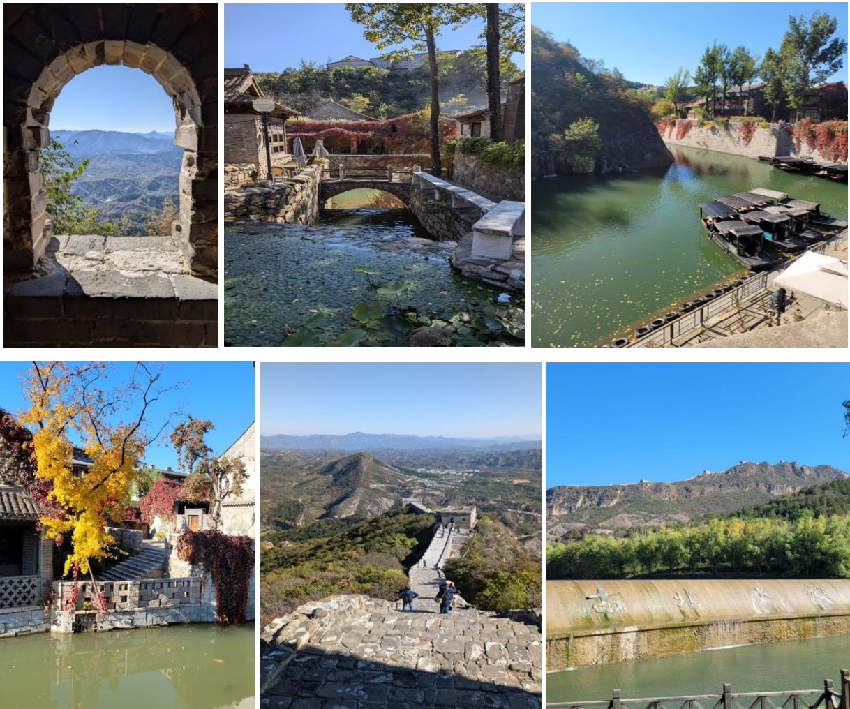
Umgebung von Peking