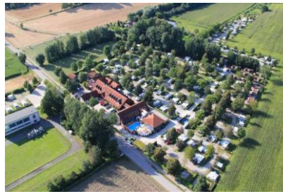
Ein Ortsteil von Bad Griesbach

Sanfte Hügel, eine malerische Altstadt und dazu ein Panoramablick bis zu den Alpen – so beschreibt sich der Luftkurort Bad Griesbach im Rottal.