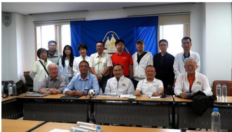
Die F.I.C.C. Asien Pazifik Kommission

Im Rahmen dieser Rallye erfolgte auch die Sitzung der F.I.C.C. Asien-Pazifik Kommission, die u.a. mit den Vorbereitungen der 95. Internationalen F.I.C.C. Rallye in Fulong/Taiwan und der 97. Internationalen F.I.C.C. Rallye 2026 in der Nähe von Peking/China ansprach.