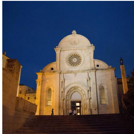
Die Kathedrale Sankt Jacob in Sibenik – UNESCO Welterbe