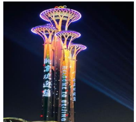
Das Olympia Stadion in Peking by night Sehenswert!