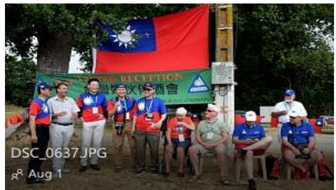
Quelques photos joyeuses de la réception de CAROC/Taiwan à Châteaubriant/France