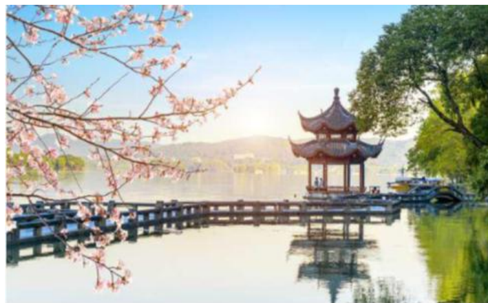
Huangzhou West Lake