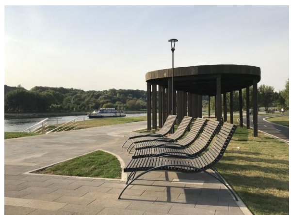
Rallye-Gelände/Rally site/Site du rallye